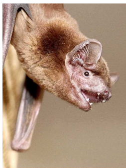
Grosser Abendsegler ( Nyctalus noctula )

Fledermäuse sind neben Flughunden die einzigen aktiv fliegenden Säugetiere. Die 28 in der Schweiz vorkommenden Arten machen einen Drittel der Schweizer Säugetierfauna aus. Alle bei uns vorkommenden Fledermäuse fressen Insekten und finden sich in den Sommermonaten in Wochenstuben zusammen um ihre Jungen gross zu ziehen.